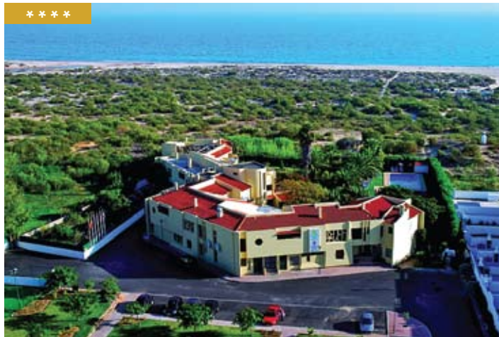
Preços por pessoa e noite / APA (€)

Turoásis situa-se numa zona calma com acesso privado à Praia da Lota, a 61 km do Aeroporto de Faro. Esta unidade dispõe de 26 quartos, incluindo 4 suites, todos equipados com ar condicionado, telefone, TV via satélite e cofre. Esta estalagem possui um bar, sala de reuniões, sala de jogos, uma piscina exterior e um campo de ténis. De referir ainda o serviço de recepção, serviço de limpeza e o parque de estacionamento privativo.