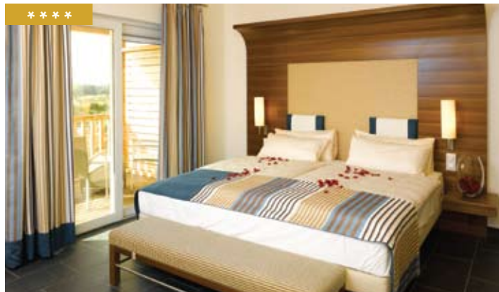
Preços por pessoa e noite / PC (€)

O Robinson Club Quinta da Ria situa-se em Vila Nova de Caceia, rodeado de vegetação e de 2 campos de golfe. Dispõe de 279 quartos, incluindo 25 suites júnior e 44 suites, todos equipados com secador de cabelo, ar condicionado, telefone directo, TV, cofre e mini bar. O complexo possui um restaurante principal e 2 restaurantes de especialidades, 4 bares, salas de reuniões, o teatro, a loja "Robin Store" e um clube infantil "Roby Club". Oferece também uma piscina exterior para adultos e crianças, uma piscina interior aquecida, um centro de fitness, ginásio com vista mar, um Spa com sauna, banho turco, massagens, tratamentos de beleza e solário, assim como 4 campos de ténis, campo de futebol, centro de ciclismo, 2 campos de golfe (Quinta da Ria e Quinta de Cima) e Academia de Golfe.