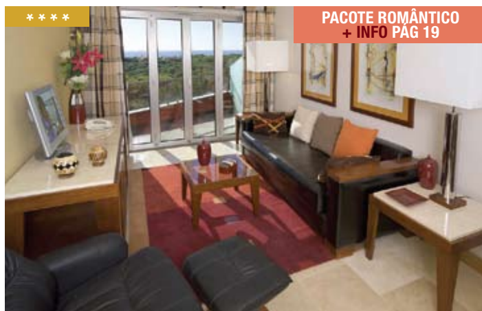
PACOTE ROMÂNTICO + INFO PÁG 19

Localizado a 100 metros da praia, o hotel conta com 40 suites equipadas com varanda, ar condicionado, telefone, TV via satélite e cofre. Está também disponível um restaurante, um bar, um snack-bar e uma piscina exterior. O hotel possui lojas, sala de reuniões até 200 pessoas, sala de TV, Internet, garagem e estacionamento exterior.