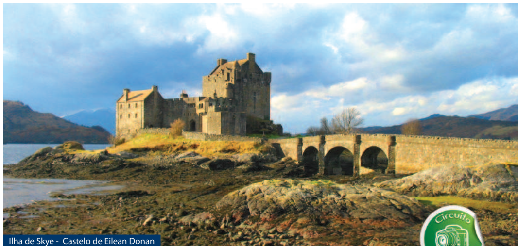
Ilha de Skye - Castelo de Eilean Donan

Edimburgo, Inverness, Loch Ness, Fort William, Ilha de Skye, Glencoe, Glasgow