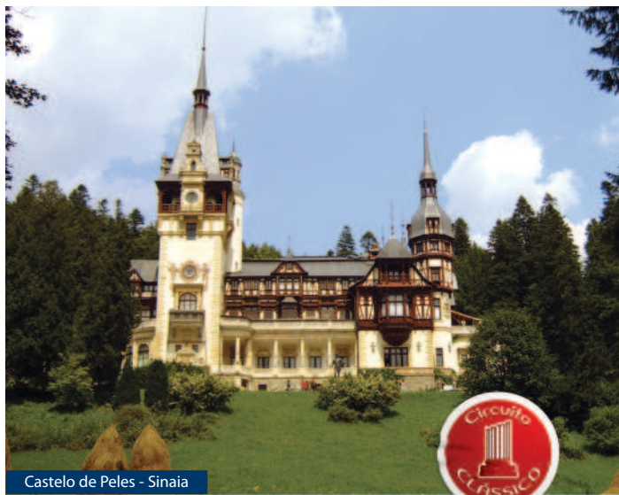
Castelo de Peles - Sinaia

Saída para Bran para visita do castelo, fortaleza do séc.XIV, conhecida mundialmente como o “Castelo do Drácula” graças aos cineastas americanos. Almoço e visita a Brasov, cidade típica e tradicional, que recorda orgulhosamente ter sido a capital da Transilvânia. Continuação para Sinaia, uma das principais estâncias montanhosas da Roménia. Alojamento.